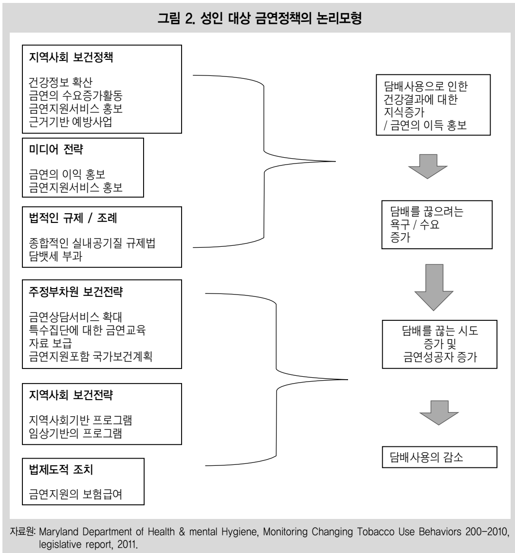
그림 2. 성인 대상 금연정책의 논리모형

이유 중에서 지난 10년간 가장 많이 증가한 금연의 이유는 어린이들에게 모범이 되어야 한다