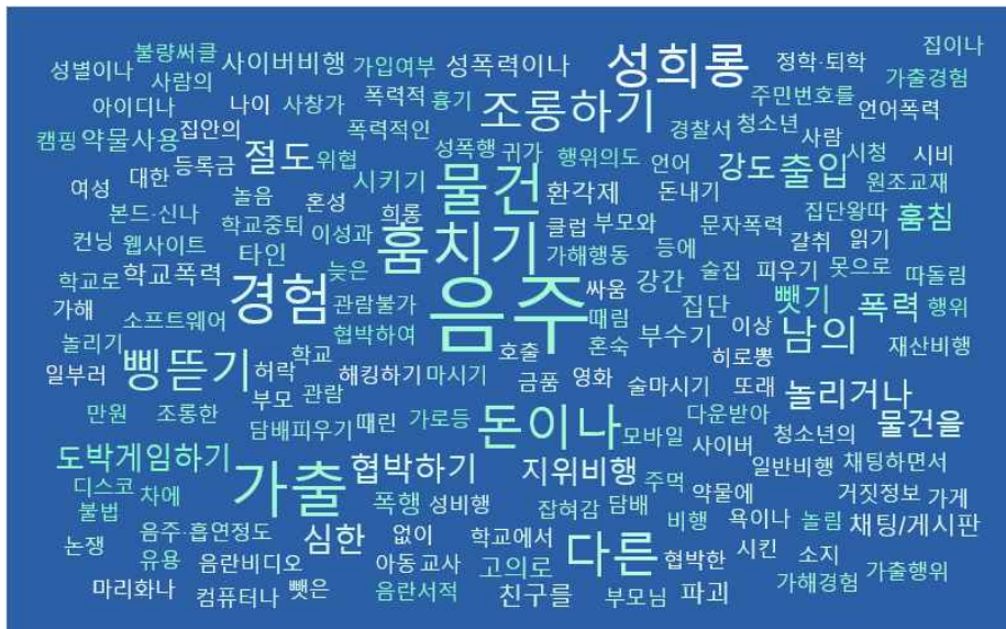
그림 2. 분석대상 논문에서 측정된 청소년 비행유형 빈도에 따른 표기

[그림 2]와 같이 가장 많이 측정된 청소년 비행을 살펴보면 청소년의 흡연·음주로 23편의 논문(5번, 6번, 8번, 9번, 14번, 15번, 16번, 17번, 19번, 21번, 22번, 23번, 24번, 25번, 27번, 28번, 30번, 31번, 32번, 33번, 34번, 35번, 36번)에서 청소년 비행변인으로 측정되었다. 이 중 흡연 및 음주만을 단독으로 측정한 논문은 5편(9번, 25번,