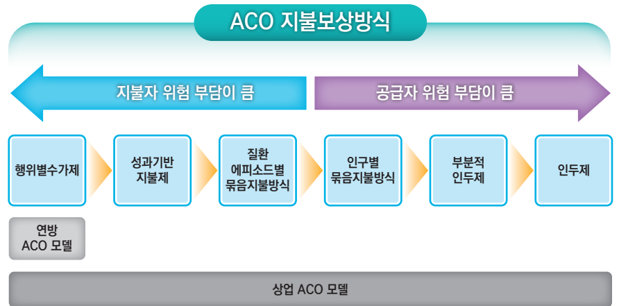
그림 2 ACO 지불보상방식

책임의료정책은 공급자 네트워크가 제공한 서비스의 질을 비용절감 효과와 함께 고려해 결과를 종합적으로 평가함으로써, 공급자가 필요한 진료를 회피하거나 질 낮은 의료를 제공할 수 있는 문제를 사전에 차단하고 있다.