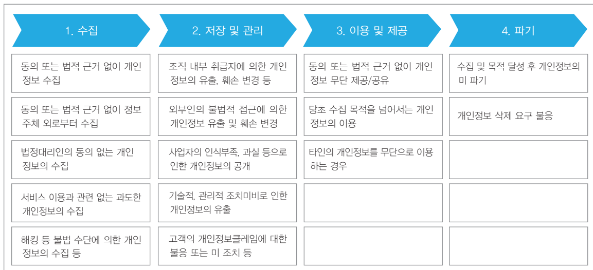
〔그림 1〕 개인정보 처리단계별 개인정보 침해유형

○ 개인정보 침해란 정당하지 않은 절차에 의해 개인정보가 수집 및 이용되고 제3자에게 제공되어 정보주체에게 피해를 입히는 것을 말하며, 개인정보 처리단계별 전 과정에서 발생 가능(그림 1 참조)