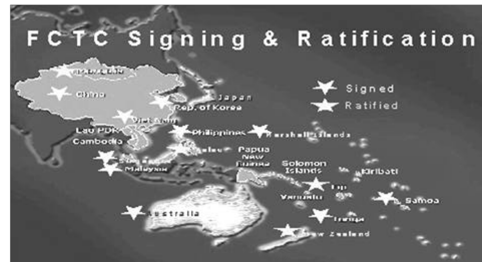
: WHO Regional Office for the West Pacific(2004 )