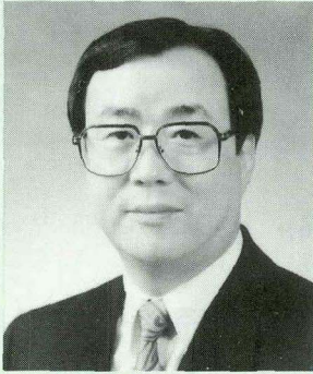
尹成泰 의료보험연합회 회장